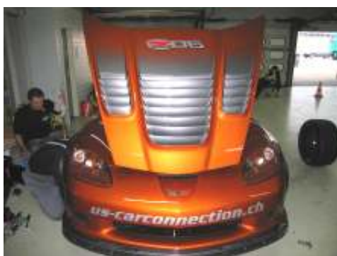
2-farben Design gegen Aufpreis