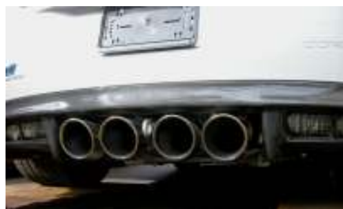
Akrapovich-Titan Klappen Auspuffanlage mit X-Pipe