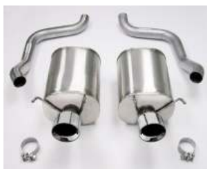
CORSA Anlage wahlw. mit 2 oder 4 Endrohre